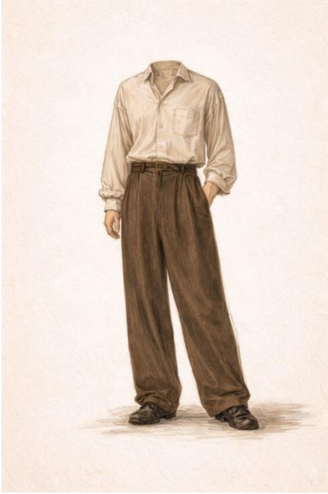
08. වෘත්තීය වර්ත