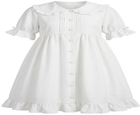
02. 02 දිය ණය